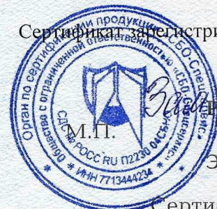
Схема сертификация 2с

Сертификат зарегистрирован на сайте СДС № РОСС RU.П2230.04СБН0 www.sbosp.ru